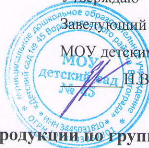
График получения готовой продукции по группам